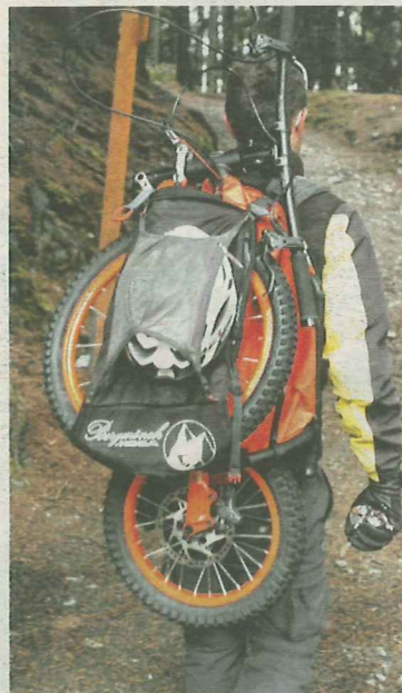
Mit dem Bergmönch unterwegs.

Wohlfühloase kurzfristig gegen Trubel eintauschen möchte – Brixen ist nicht weit.