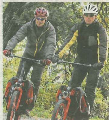
...ins Tal zu brettern.