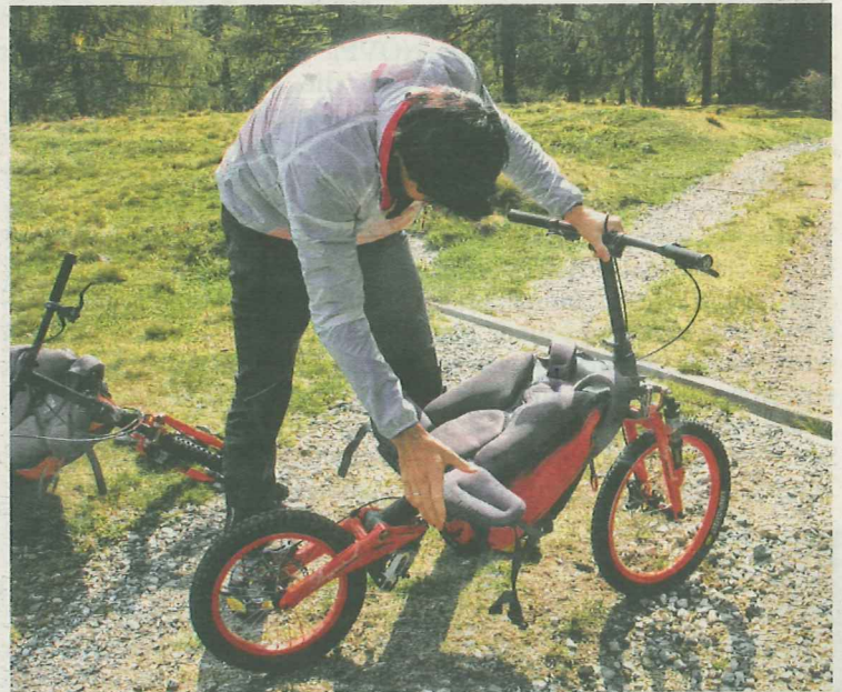
Oben angekommen, wird das Rad zusammengebaut, um schließlich...