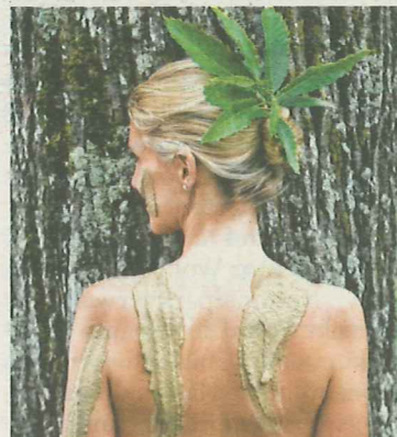
Wellness mit Kastanien-Kosmetik.