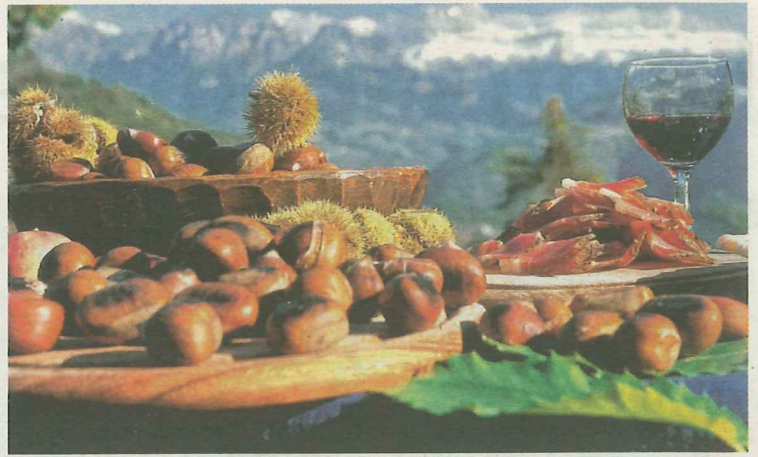
Ein Gedicht zur Marende: Esskastanien, Speck und Wein.